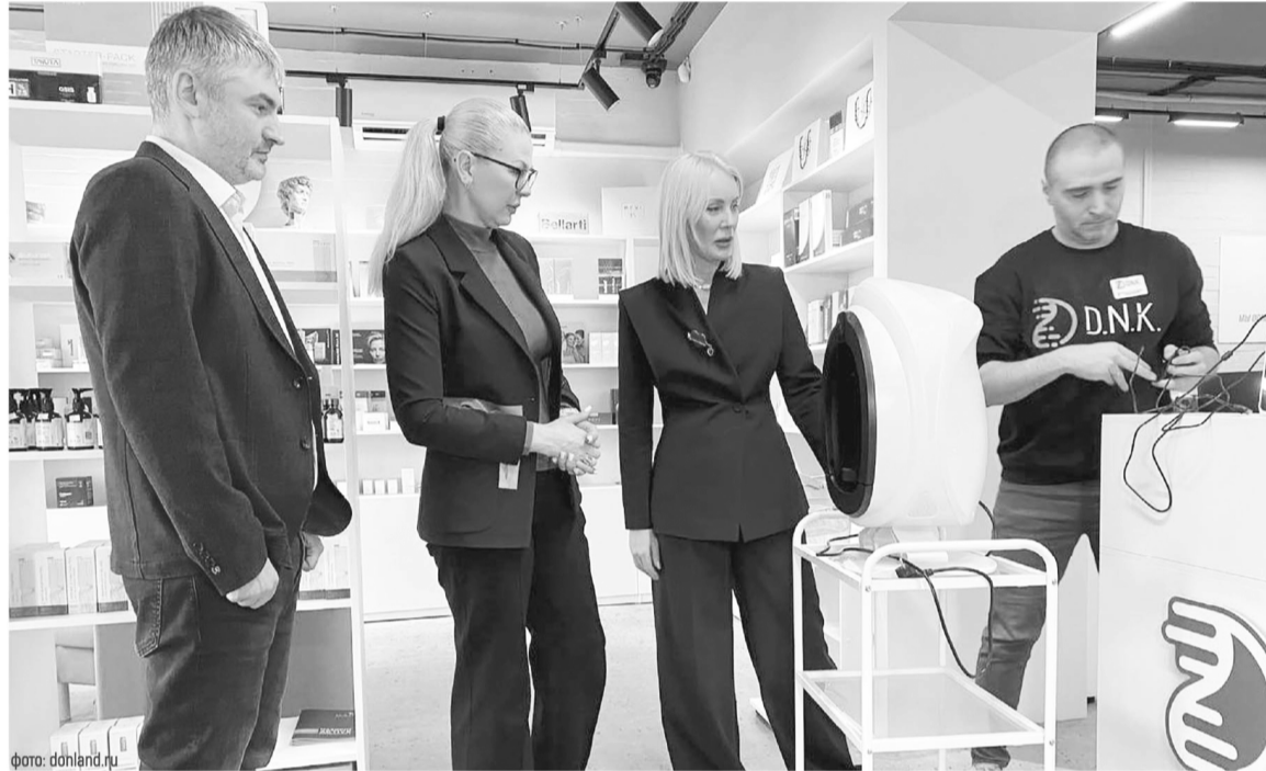
В Ростовской области проводятся проверки товаров различной категории. Лучшие производители не только подтверждают качество товаров, но и становятся обладателями знака «Сделано на Дону»

По итогам работы десяти таких приемных в 2025 году было проконсультировано более 3 тысяч человек, подготовлено около 340 претензий. Во внесудебном порядке урегулировано споров на сумму около 3,6 млн рублей, сумма начисленных штрафных санкций по исковым заявлениям