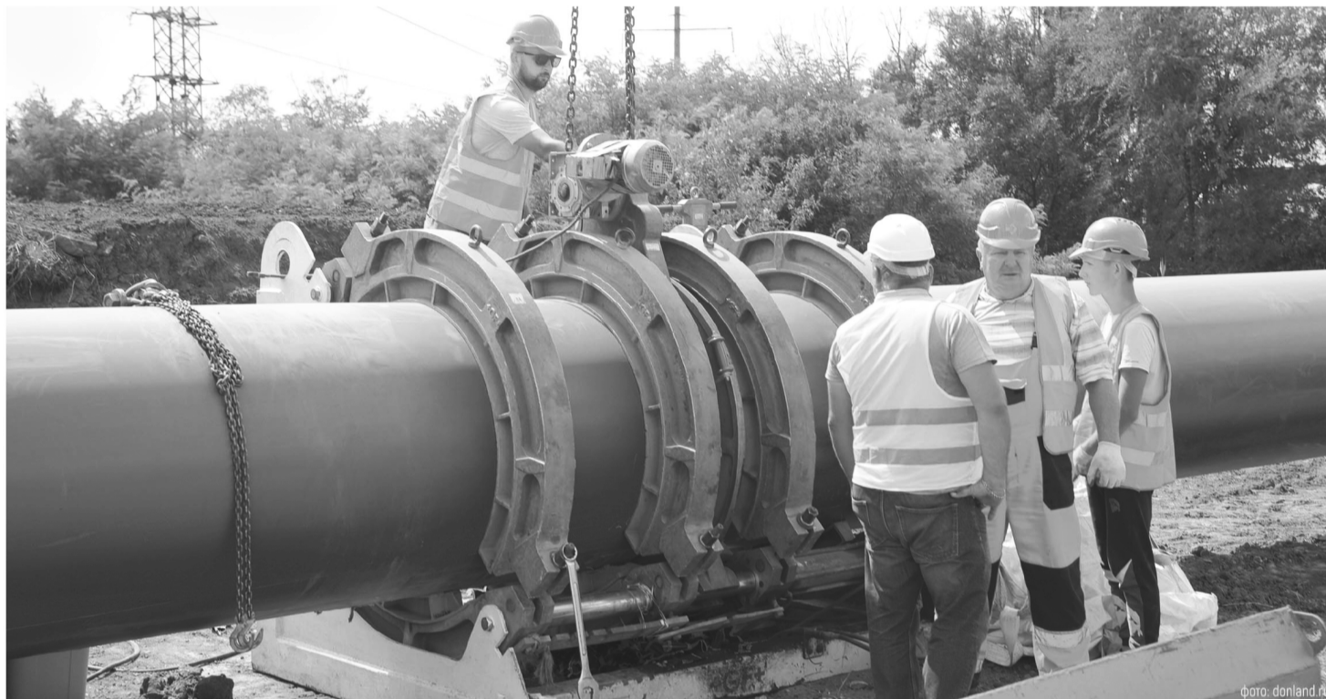
Основная задача сферы ЖКХ в 2026 году – повышение комфорта жителей региона, а новой стратегией должен стать отказ от практики «латания дыр»

По мнению губернатора, несмотря на сложности, в прошлом году удалось достичь конкретных и заметных результатов в сфе-