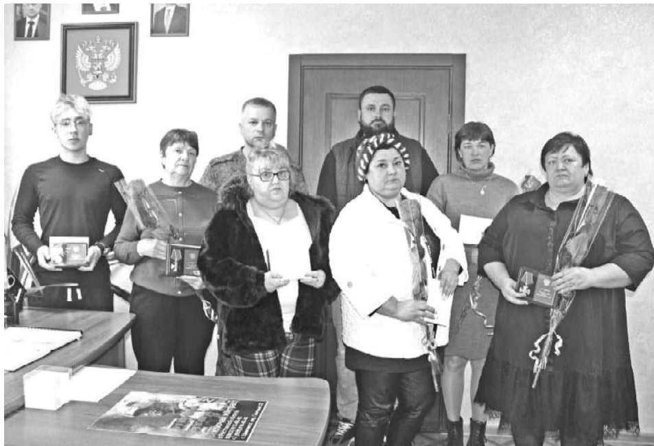
женец станции Камышевская.