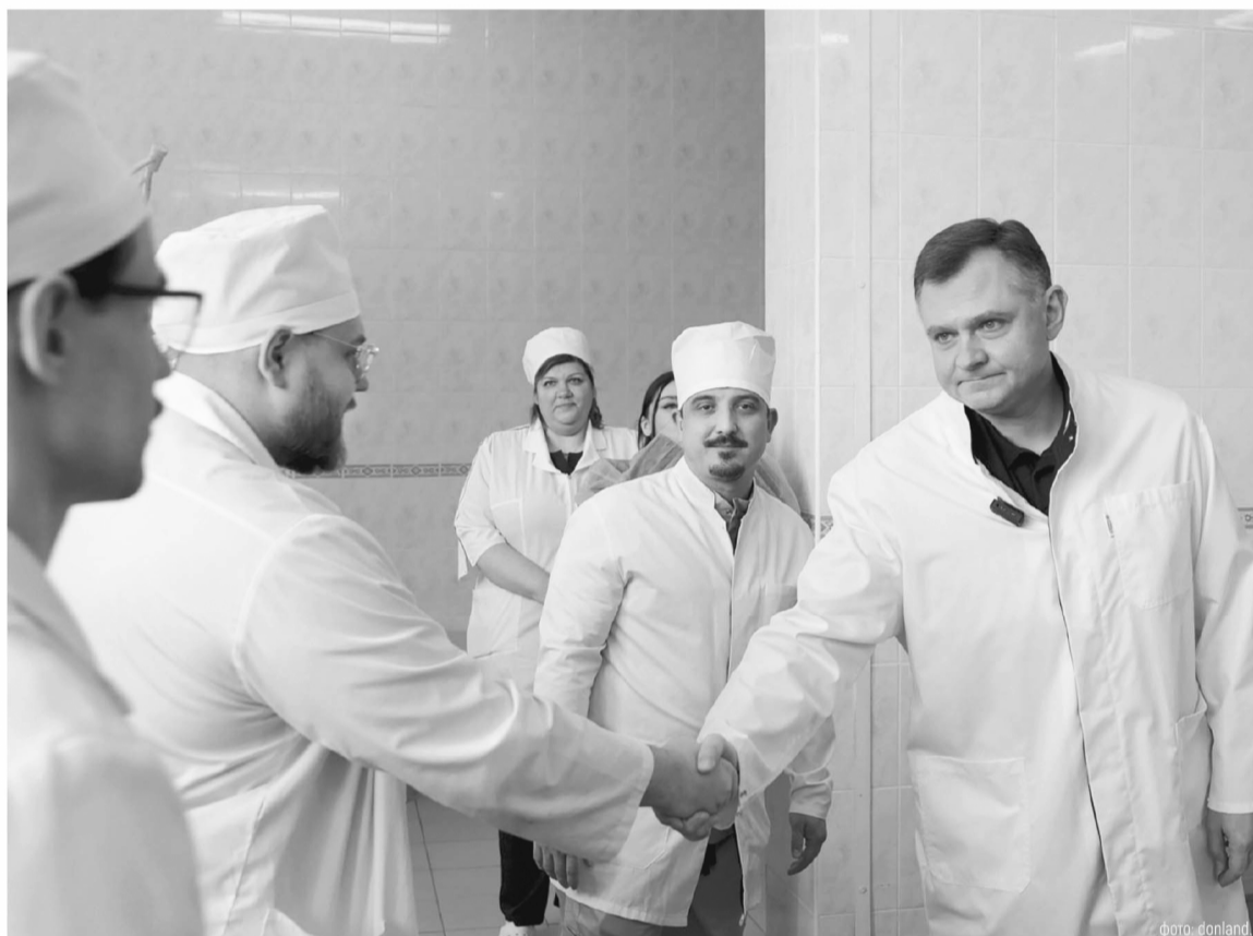
Глава региона Юрий Слюсарь считает, что основная задача властей всех уровней – повышать укомплектованность кадров во всех сферах

Кроме федеральных выплат сельские специалисты могут рассчитывать и на дополнительные меры поддержки – региональные и муниципальные. Взять, к примеру, сферу здравоохранения. Прибывшие в сельскую местность врачи могут получить 1,5 млн рублей подъемных, средние медицинские работники – 750 тысяч рублей, в малонаселенных городах размер выплаты составляет 1 млн рублей и 500 тысяч рублей соответственно. Среди региональных мер поддержки медиков – ипотека под 1% для выпускников-отличников, жилищные субсидии для молодых специалистов и работников дефи-