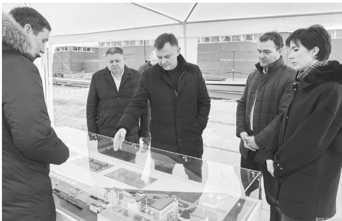
Развитие производства в районах Ростовской области – это вклад в развитие экономики всей области