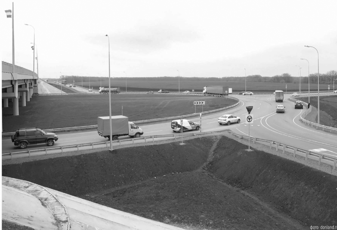
В 2026 году в Ростовской области приведут в порядок более 450 км дорог

В ряде районов области, в Батайске, Гукове и Новочеркасске в нормативное состояние