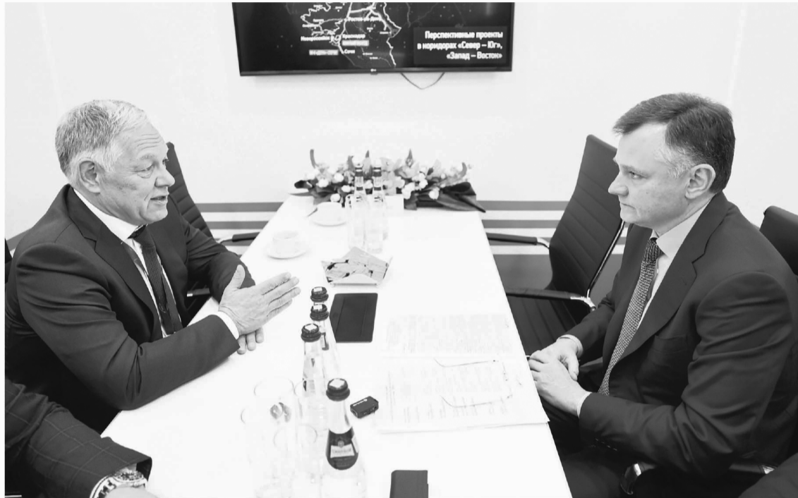
Одна из важнейших магистралей на территории Ростовской области будет модернизирована. Это важно для жителей региона, это важно для страны

Один из реализующихся в Ростовской области проектов – расширение трассы М-4 «Дон» между Каменском-Шахтинским и донской столицей. На всей М-4 эти 94 км – самый узкий участок, и любой из опрошенных автолюбителей назовет его самым слож-