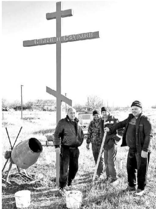
До недавнего времени одна из крупных станиц района - станица Большовская поклонно-

Почти во всех населённых пунктах Волгодонского района на въезде установлены православные святыни - поклонные кресты - знак того, что тут проживают православные люди и напоминание о том, что отправляясь в дорогу, нужно перекреститься и попросить благословение у Бога.