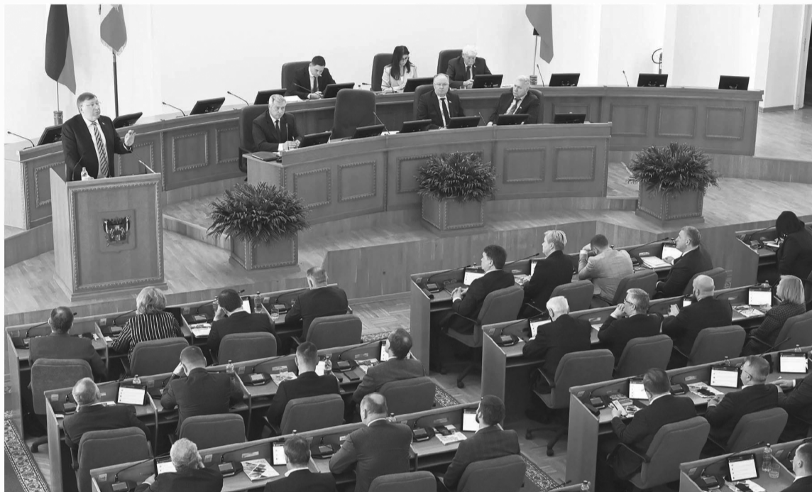
Шестое заседание Законодательного Собрания области было посвящено принятию самых актуальных решений

В два раза была увеличена и ежемесячная денежная выплата на каждого ребенка в многодетной семье. Сейчас ее размер – 521 рубль, после повышения она составит