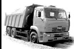
ИП Сержанов Н.В. Реклама (№ 145)