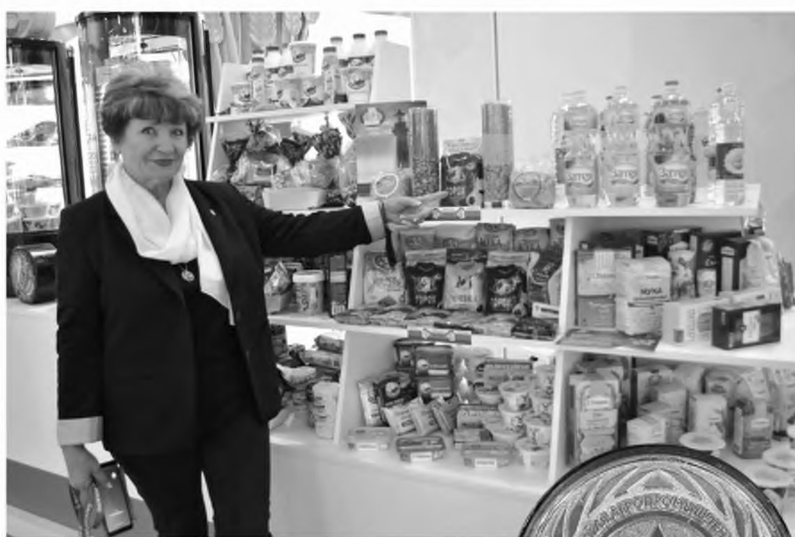
Донскую продукцию оценили по достоинству – на золото и отлично

Павильон животноводства на выставке в этом году занял 2,5 тысячи квадратных метров и представил лучшие достиже-