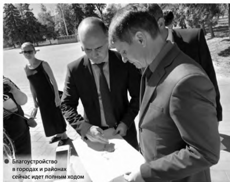
Благоустройство в городах и районах сейчас идет полным ходом

Для сравнения – в Ростовской области в 2020 году в голосовании приняли участие более 400 тысяч человек. Во всероссийском голосовании 2021 года поучаствовали более 460 тысяч человек. Мы видим, что люди стали более активно проявлять интерес к реализации объектов благоустройства.