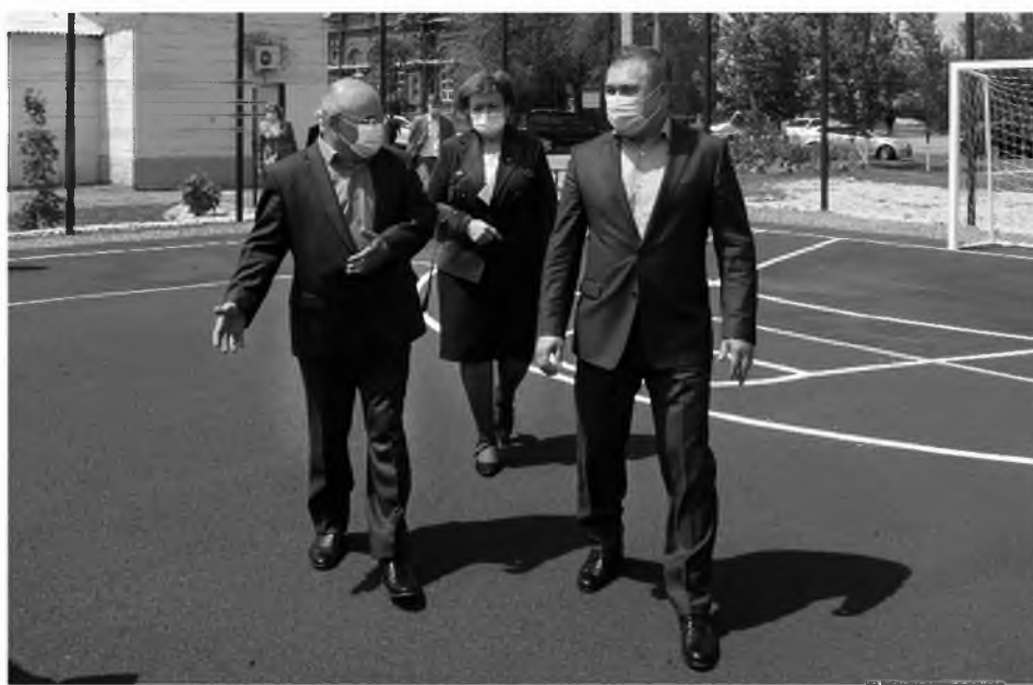
Донские села меняют облик и радуют тех, кто выбрал жизнь и работу на родной земле

На реализацию программы в прошлом году было направлено около 1 млрд рублей, причем три четверти объема – средства области, из федерального бюджета поступило 268,5 млн рублей. Благодаря программе улучшили жилищные условия 126 сельских семей – все они трудятся на предприятиях АПК