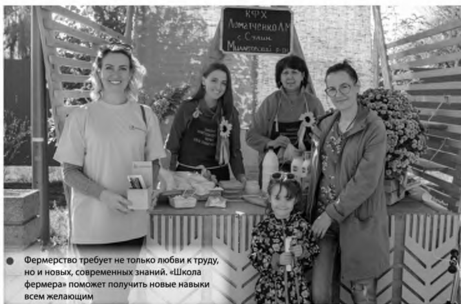
Фермерство требует не только любви к труду, но и новых, современных знаний. «Школа фермера» поможет получить новые навыки всем желающим

Всем желающим принять участие в новом обучающем проекте «Школа фермера» нужно подать заявку по электронной почте konkurs-fermer61@dongau.ru . Подробности можно уточнить по тел. 8-938-112-89-25 или направив обращение на сайт www.rshb.ru .