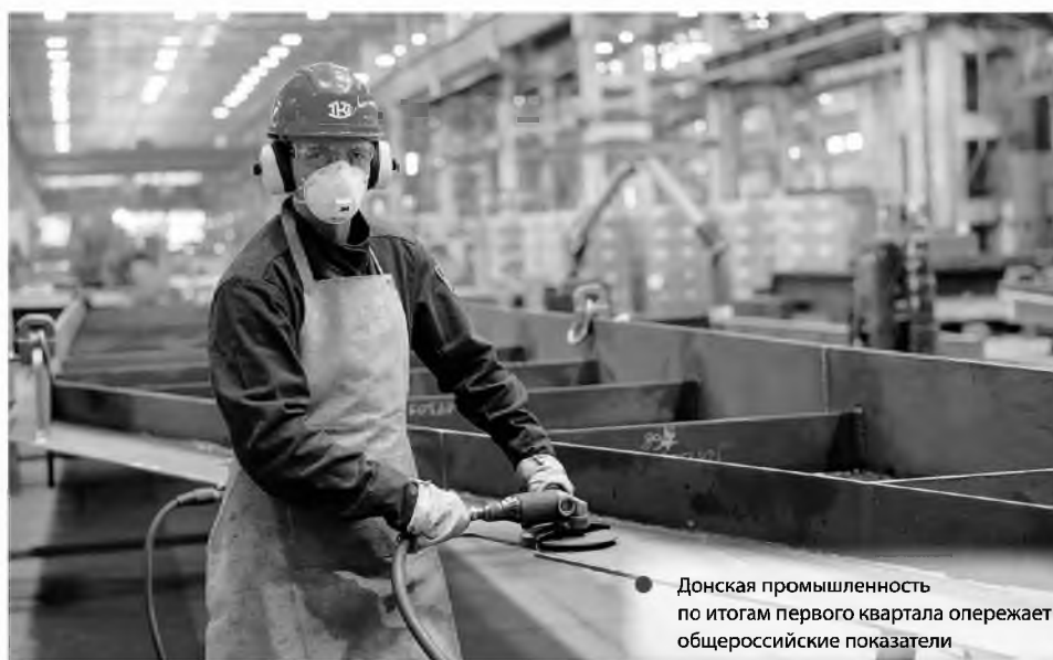
Донская промышленность по итогам первого квартала опережает общероссийские показатели

За три месяца 2021 года рост производства химических веществ и химических продуктов составил 149,5%, текстиль-