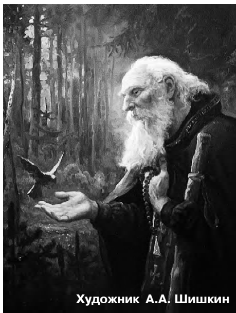
Художник А.А. Шишкин

Чтоб хищно не мигая взглядом, При солнце или при свече Была все время птаху рядом В шкурье вкогтившись на плече.