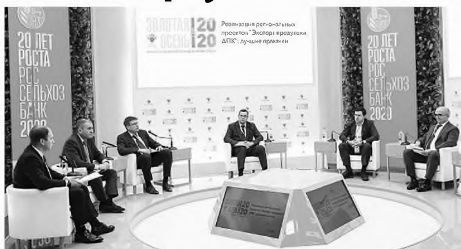
Деловое общение в рамках выставки «Золотая осень» состоялось в дистанционном формате

Ростовская область поделилась опытом организации экспортных поставок продукции АПК на 22-й агропромышленной выставке «Золотая осень-2020», которая проходила в онлайн-режиме.