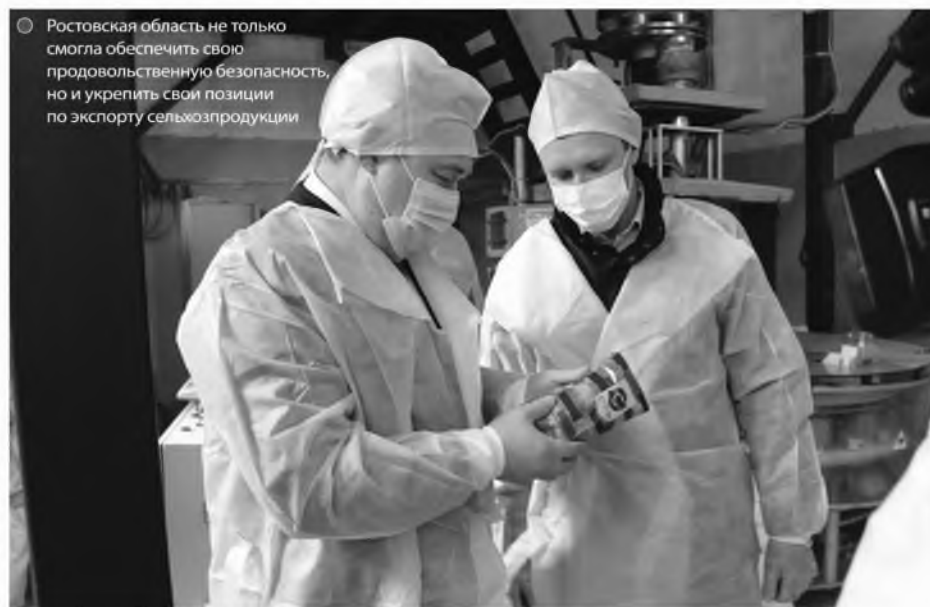
Ростовская область не только смогла обеспечить свою продовольственную безопасность, но и укрепить свои позиции по экспорту сельхозпродукции

Зерна в Ростовской области в несколько раз больше, чем требуется населению, самообеспеченность зерном у нас почти 405%. Яйцом мы обеспечены, на первый взгляд, по сравнению с зерном, вроде бы и не так внушительно, но тем не менее тоже сверх потребностей населения – на 123%, молоком и молокопродуктами – на 98,9%, мясом, мясопро-