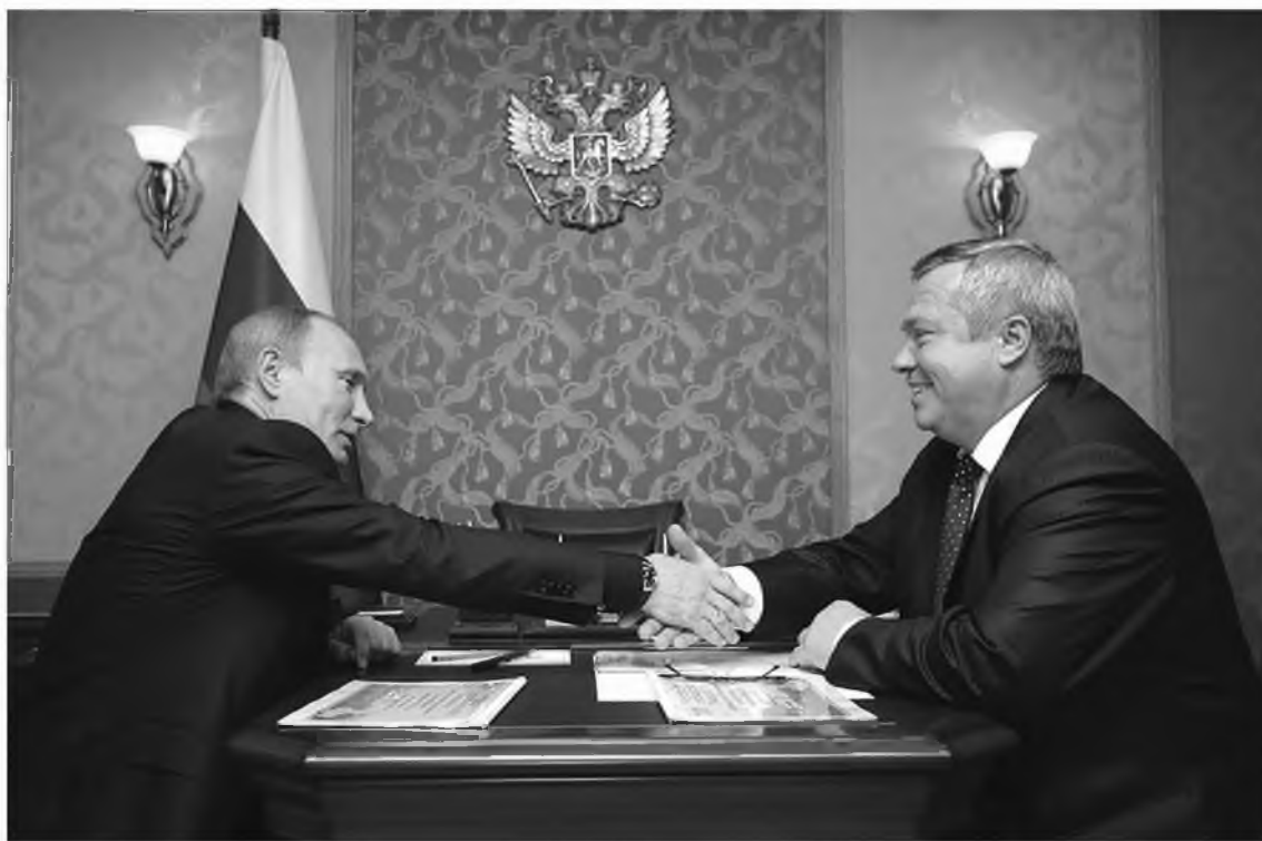
● Президент страны и донской глава обсудили ряд важных для развития региона вопросов. Владимир Путин обещал поддержку новым инициативам (фото из архива)