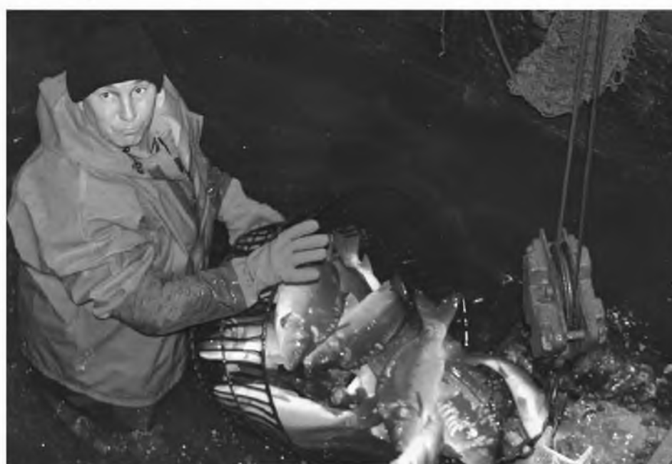
Самые популярные в донской аквакультуре – карповые

По данным Минсельхоза России, Ростовская область производит около 12% от общероссийского объема товарной рыбы и почти 40% по Южному федеральному округу. Воспроизводством водных биоресурсов занимаются пять федеральных предприятий. Более 50 предприятий осуществляют промысел биоресурсов в Азовском и Черном морях, р. Дон, Веселовском, Пролетарском