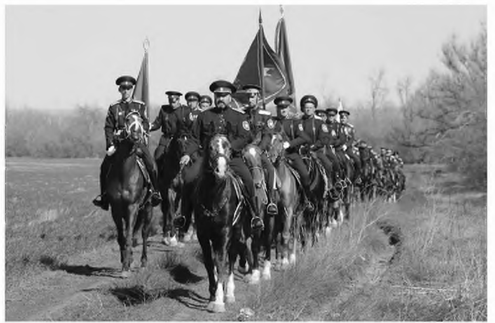
● Донские казаки – пример самоотверженного служения Отечеству

Определено, что пленарная сессия Всемирного конгресса казаков и заседания круглых столов в Новочеркасске