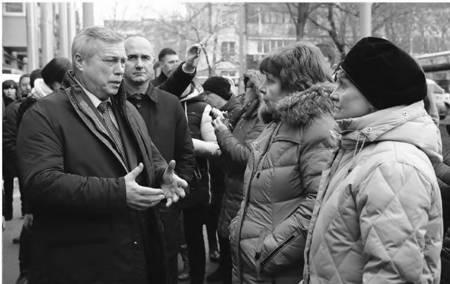
● Василий Голубев общается с людьми не только через СМИ — рабочие поездки в районы области всегда подразумевают личные встречи с жителями

К слову о переменах. Журналисты поинтересовались мнением губернатора о событиях «январского экватора», в част-