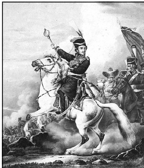
Орловский А.О. Портрет М. И. Платова. 1812-1813 г.г.

В 1581 году донскими казаками под предводительством Ермака Тимофеевича